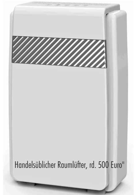
Handelsüblicher Raumlüfter, rd. 500 Euro"

Es wird immer gern betont, wie wichtig Kinder und Bildung in unserem Land sind. Treten aber Kosten auf, sind sie nur lä-