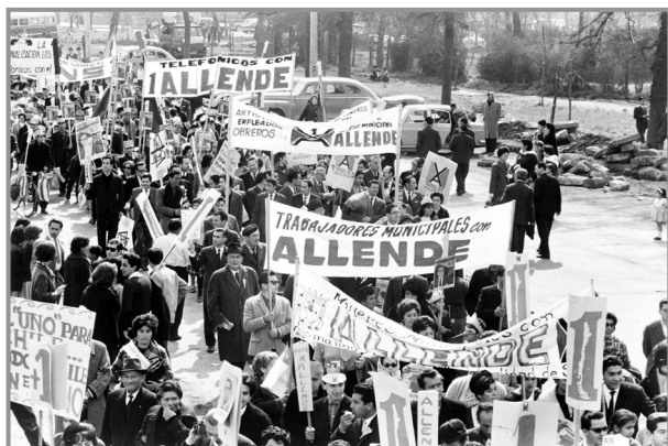
Demonstration für Allende 5. September 1964

War der „Friedliche Weg“ also ein Holzweg? Hätte Allende die Wahl zum Präsidenten lieber nicht gesucht?