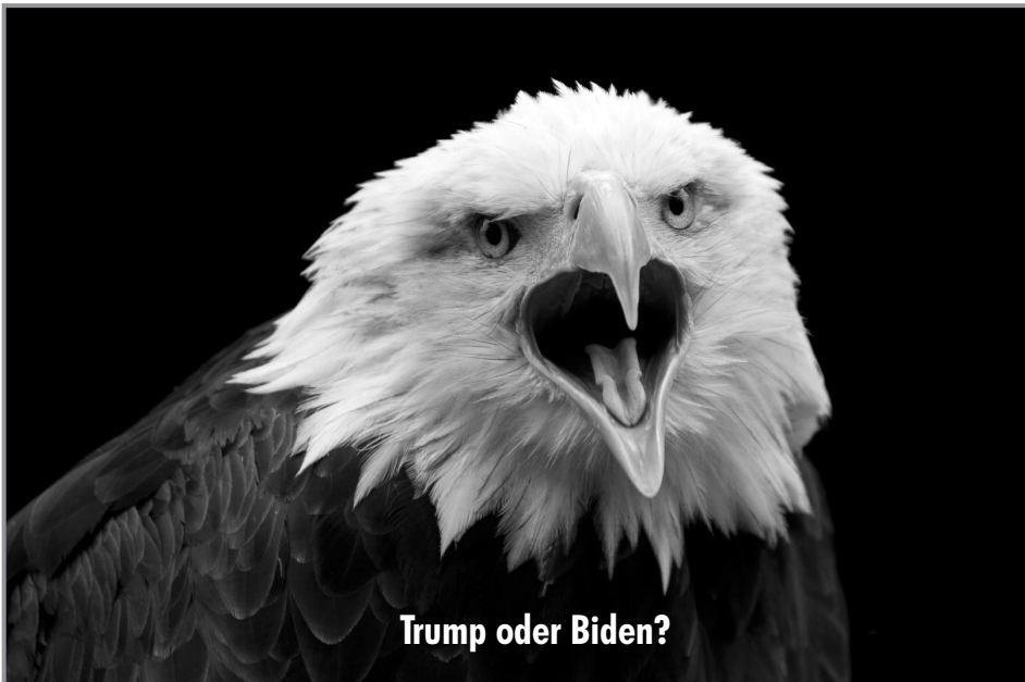
Trump oder Biden?